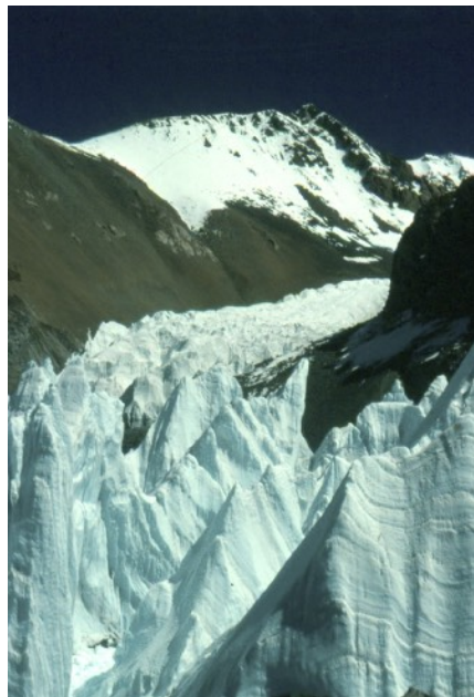
Desde el Campo Base I: parte final de la morrena y glaciér Rombuk, que desciende por la cara norte del Everest, que aparece al fondo. Imagen: Nacho Fdez., 1993, padre de Olaya.