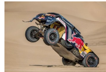
Imagen obtenida de la web oficial del piloto

El coche fue confeccionado por las expertas manos de Stéphane Peterhansel (13 victorias en el Dakar), Sebastien Loeb (9 mundiales de rally), Cyril Despres (5 victorias en el Dakar) y Carlos Sainz. A la retirada de la escudería, podría sumarse la de su piloto vencedor, es decir Carlos Sainz, que lleva ya varios años pensado dejar el mundo de la alta competición,