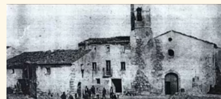
Imagen de Mengollo.

Mengollo es un pueblo perteneciente al concejo de Quirós, situado al sur de Asturias. Antiguamente poblado por solo una veintena de habitantes, nos trae hasta la actualidad una incógnita sin resolver.