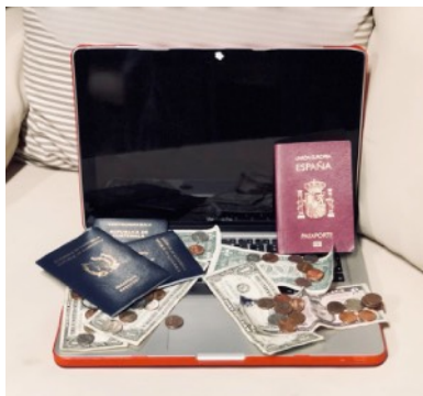
Tus datos y tu dinero a exposición pública en los aeropuertos estadounidenses.

Otra cosa sería que te los hackearan y pudieran ver más allá de lo que se ve de ellos en una primera mirada.