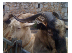
Ganado cabrío en Tielve

Tielve siempre fue ganadero, y produce probablemente el mejor queso de Cabrales que se puede comer. Y aunque ya hace unos 45 años que se empezó a subir por la carretera, y desde esas fechas el pueblo evolucionó mucho, todavía sigue fiel a su historia, su buen hacer y sus tradiciones.