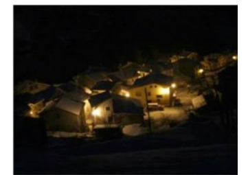
Tielve, desde Rieses. J. G. Bada