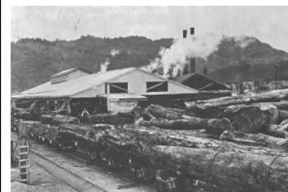
Antiguo aserradero en Ongarue, NZ.