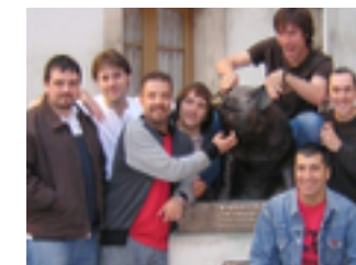
Dixebra 2013. Tiempos Modernos

Fuente: todo esto me lo contó mi padre, uno de los miembros fundadores del grupo.