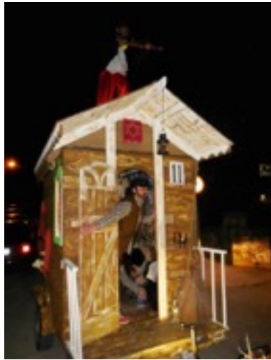
“El violinista” de Posada, doblando premio en Cangas de Onís.

Lo cierto es que el nivel del desfile cada año va a más, no pudiendo decir lo mismo del número de personas disfrazadas, que pocos eran los que se habían animado; muchos le atribuían todas las culpas al frío, pero con excusa o sin ella el Carnaval Botijo sigue vivo, y con más ganas cada año de mejorar en sus exhibiciones.