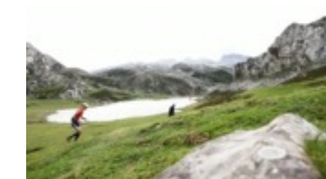
Imagen de la Xtreme Lagos, 2015.

Uno de los grupos más destacados de la comarca es el Grupo de Montaña "Peña Santa". Fue creado en 1945 por Julián Delgado Ubeda, en Cangas de Onís; y actualmente cuenta con 21 participantes inscritos en las carreras de montaña, además de los que compiten en la escalada, tanto en la modalidad de rocódromo como en la de roca.