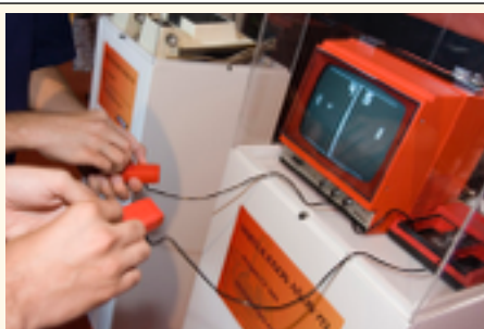
Videojuego antiguo. L. Fisher. CNICE

Tres años más tarde conocimos a Link, ese chico rubio al que muchos llaman Zelda, y