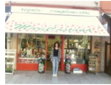
Ayudando en el comercio familiar. T.P.

Como conclusión, el sector de la hostelería es el más demandado también entre nuestros compañeros.