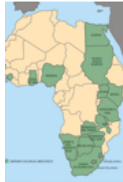
Colonias británicas en África, en el siglo XIX J. Santamaría, CNICE

La liberación de Nelson Mandela en el 1990, después de 27 años de prisión, y