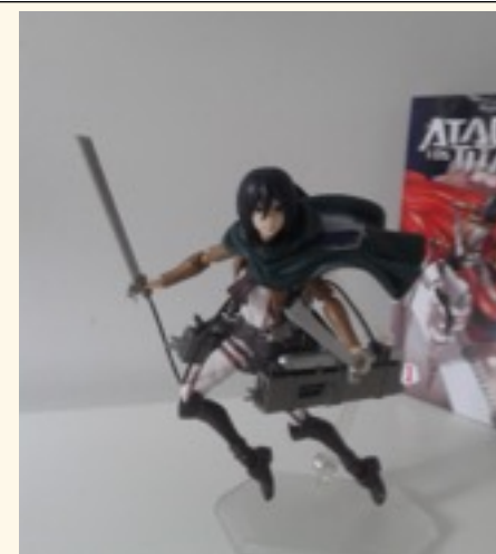
Imagen: Guillermo M.

Ranma ½,, uno de los nuevos protagonistas, cayó a un pozo de agua mágica. Desde entonces, cuando toca agua fría se convierte en mujer. También se va