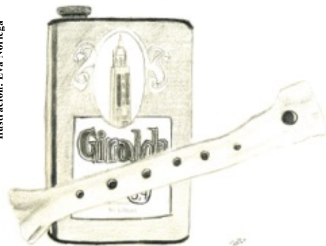
Ilustración: Eva Noriega

Teresa Pérez Rey. Vengo de una familia donde la música asturiana no falta y la gaita es prácticamente un miembro más. Lo difícil es imaginar el origen tan peculiar de esa pasión: una pata de cabra.