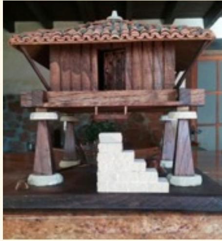
Hórreo en miniatura. Realizado por Javier Sierra

Después de obtener las medidas, tanto del hórreo grande como de la miniatura, dividimos las alturas del pegoyu -por ejemplo- obteniendo una proporción.