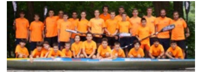
Club Sirio-Los Cauces, Cangas de Onís

Cuenta en la actualidad con 39 fichas (37 hombres y 2 mujeres), de las cuales 29