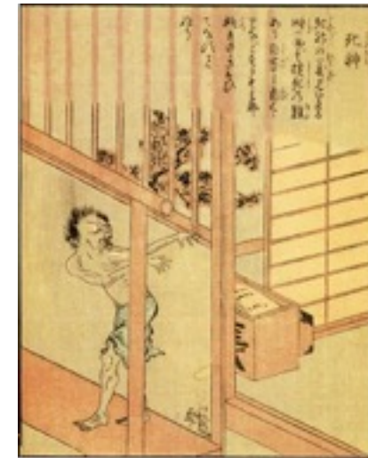
Representación de un shinigami en el libro Ehon Hyaku Monogatari .

Personalmente creemos que el final es la lección más importante: si juegas con fuego te acabarás quemando.