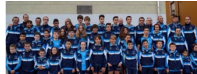
Club Los Rápidos-Jaire, de Arriondas