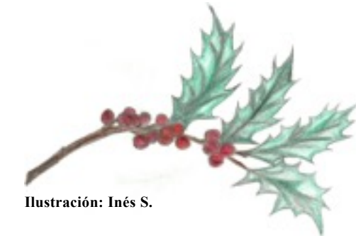
Ilustración: Inés S.

Las flores son unisexuales, pequeñas, muy perfumadas y de color blanco y rojizo, y solo se podrán observar en primavera, cuando los aceros florecen. Su altura media se sitúa en torno a los 2 metros y su edad media está entre los 75 a 100 años, aunque existen ejemplares que pueden llegar a medir 20 metros y alcanzar una edad de 500 años.