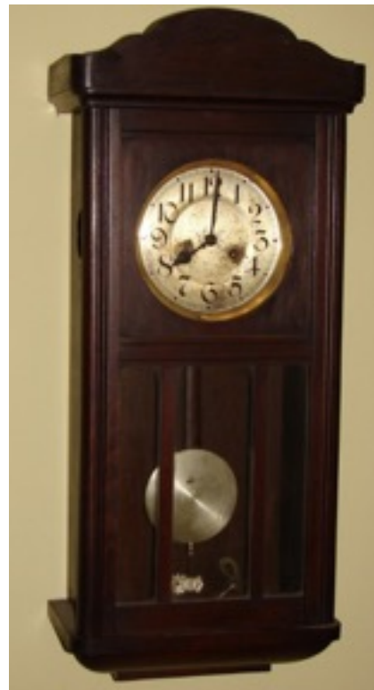
Uno de los relojes reparados por Manolo

A su regreso tuvo la idea y la oportunidad de abrir su propia relojería en Arriendas: pagaba 900 pesetas por el alquiler del local y el hospedaje.