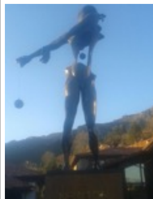
Estátua dedicada a Newton, Salvador Dalí Cofiño (Parrés).

La 1ª está en la Plaza de Salvador Dalí, en Madrid. La 2ª está en el Palacio de Los Quirós, en Labra, que son marchantes del arte, y la 3ª (en la imagen) en Cofiño, en el complejo hotelero Pueblo-Astur.