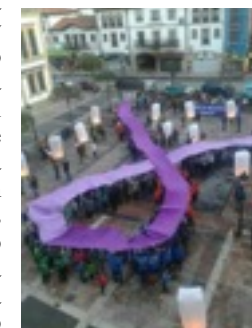
Concentración en apoyo a las víctimas de violencia de género, Cangas de Onís.

mujeres sufrieron asaltos y agresiones sexuales de bandas organizadas, formadas aproximadamente por centenares de hombres desaprensivos de cultura machista.