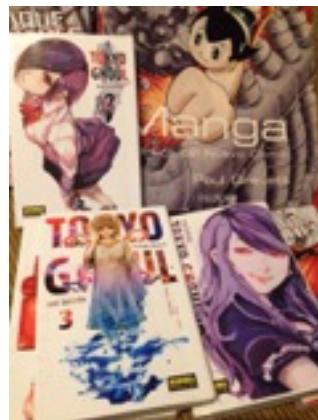
Algunos mangas y un libro que trata sobre su contenido

Sin embargo, Japón siempre destacó por su capacidad de asimilación y mejora de nuevas ideas para superar las situaciones difíciles. Gracias a ello pudo convertirse en un imperio económico tras su derrota en la Segunda Guerra Mundial y la ocupación de los estadounidenses, quienes consideraban