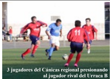
3 jugadores del Cánicas regional presionando al jugador rival del Urraca B