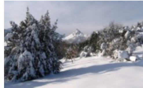
Carrascos en Peloñu, Ponga.