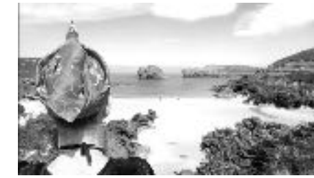
Pañuelo repicado. L.P.

Mientras que el traje de asturiana es un traje que la mujer usaba para el trabajo, el de llanisca se ponía en días festivos. En cuanto a las diferencias, en el de asturiana