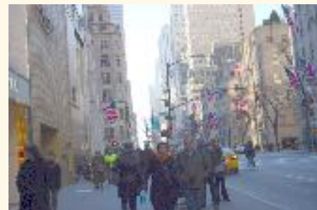
Barras, estrellas y patriotismo. Leire E.

NY es una ciudad gris llena de rascacielos imposibles, de un ajetreo constante de coches y de personas ocupadas. El único rincón que contrasta con ese paisaje es Central Park , del que me sorprendió saber que sólo media 3,41 km².