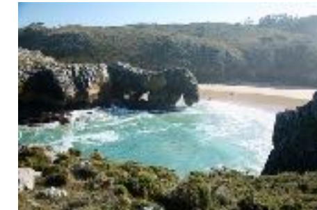
Desde el top de la escalada. Cuevas del Mar, Llanes. P.Z.

Este tipo de paisaje costero permite realizar otras actividades, como ejemplo la escalada de varios tipos: la deportiva, el bloke y posiblemente la más espectacular de todas, que es el psicoblock (una escalada por encima del agua).