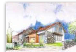
Arriba: boceto de vivienda en Vallobil