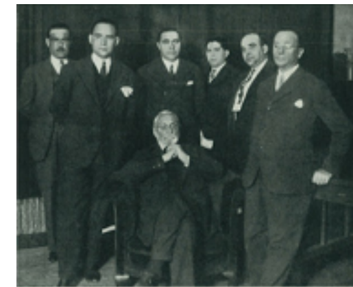
Izquierda: casa que lo fue de Francisco de la Vega (La Robellada, Onís). Derecha: el poeta (tercero por la derecha), junto con Miguel de Unamuno y otros miembros de la Alianza Republicana, una coalición de partidos y movimientos de carácter republicano formada durante la dictadura de Primo de Rivera.