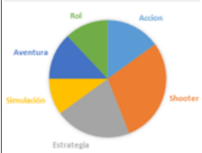
Géneros populares. Gráfico de E. Díaz

Por último, están los videojuegos de rol , cuya principal característica reside en el conjunto de papeles y personajes desempeñados, uno de ellos por parte del jugador.