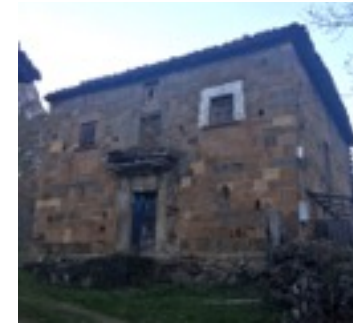
Torre de Siña (Amieva).

Tiene una dimensión cuadrada de 11x11 metros y se constituye por dos alturas; la puerta principal conduce a lo que fue el comedor, donde dos puertas dan paso a la