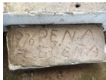
Actual escalón de la bolera de Mestas de Con con el nombre y año de la formación de la peña

Durante la guerra civil desapareció la recién formada Federación Asturiana de Bolos (FAB), y con ella muchas boleras. Tras el fin de la guerra hubo que hacer