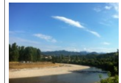
El río Sella, a su paso por Arriendas.