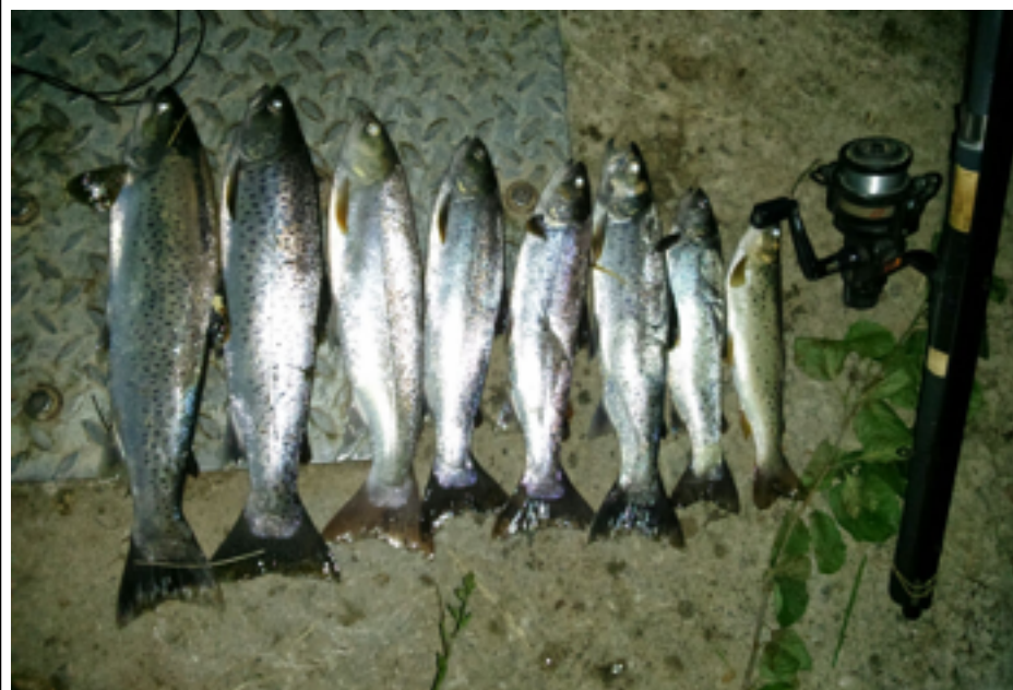
Siete reos y una trucha pescados en la zona libre de El Seu (Río Cares).