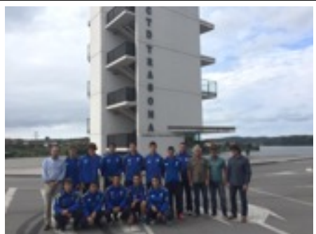
Equipo concentrado en la temporada 2016-17

Los objetivos de los deportistas concentrados allí son las distancias olímpicas principales: 1.000 metros, 500 metros y 200, que se preparan en unos selectivos nacionales a través de los que se puede acudir a los Campeonatos del Mundo y de Europa Junior. En el año 2014 llegaron a proclamarse Campeones del Mundo de K4 1.000 metros en Szeged, Hungría.