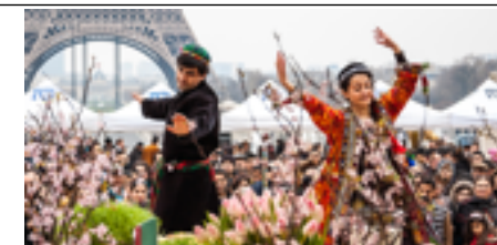
El Nowruz a salvo de la guerra.

Hace menos de una década, en los suelos abrasados por las bombas, la misma gente bailaba, se abrazaba... y todos brindaban