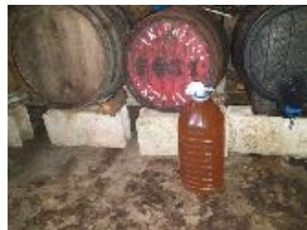
Barricas con el mosto en fermentación y garrafa “moderna” de sidra dulce.

El zumo se almacena en barriles y se deja fermentar de dos a tres meses. Después se envasa en botellas.