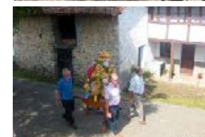
Procesiones en Sinariega. Arriba, a finales de los 50. Abajo, en 2016

olvido y por ello decidió dar a conocer sus tradiciones.