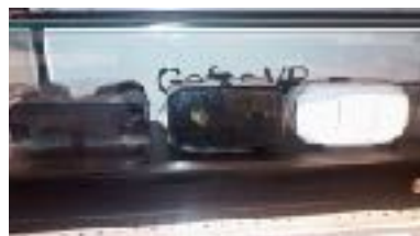
Gafas de realidad virtual a la venta en dependencias de Intu-Asturias, antiguo Parque Principado.

Y está claro que conoces el mundo entero si quieres en un día, pero no vas a disfrutar de la misma forma que yendo tú mismo a ese lugar.