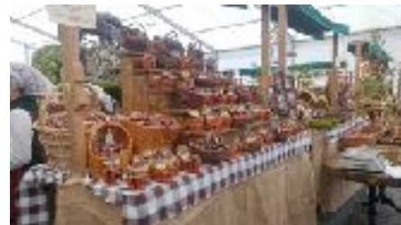
Certamen de la Castaña, Arriendas 2017

Este pasado 10, 11 y 12 de Noviembre se ha celebrado en Arriendas la XXVII edición del Certamen de la Castaña y Productos de la Huerta . Durante esos días la Plaza Venancio Pando y los alrededores del Ayuntamiento de Arriendas se llenan de pequeños puestos donde podemos encontrar toda la variedad de productos