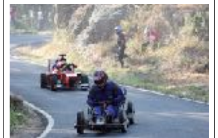
Carrilanas en descenso

Así que ya sabéis: si queréis sentir adrenalina con vuestros amigos o familiares, primero tendréis que poneros a diseñar y elaborar vuestro coche, empleando todo tipo de materiales y, por supuesto, armándose de valor y rezando para no darse un buen golpe.