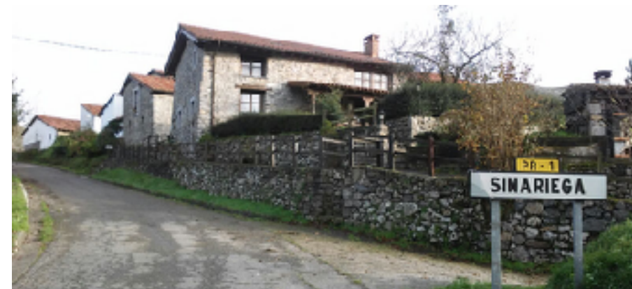
Entrada al pueblo desde la carretera que sufre de Arriondas, pasando por Fuentes