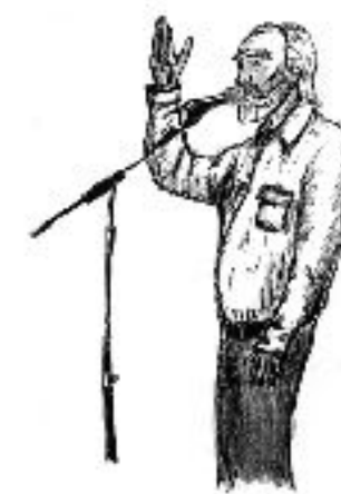
Javier Krahe, según Alberto Cla

Su voz y su barba siguen como siempre: fuera de control. La mesita sin tabaco y, supliendo su ausencia, agua, gúisqui y jarabe para la tos. Comienza el espectáculo. Ahora tres palabras y un tosido, mil pensamientos por segundo y sí; se pone feo al cantar. Los arpegios del maestro se funden entre risas, los aplausos a medio verso, y la flauta del extranjero suena como flauta o como teléfono, siempre a gusto y placer. La escena es carne de Bakunin pero, no todo va ser follar : detrás de la espontaneidad hay tablas, rodaje y milenta años de ensayo. Sus poemas son sus penas, sus penes y, por dinero, el dos de mayo... cualquier tema bueno, es bueno, para hacer una canción. El Cuervo Ingenuo grazna en la tarima y los apaches, desde abajo, disfrutando con su pipa de la paz. Vuelven la conocidas. La comidilla. Pero ya queda menos. Se van. Entran. Tocan dos. Y al final, el gilipollas , volvió a marchar sin cantar la de Marieta . El innombrable.