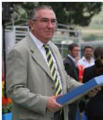
El recientemente fallecido Carlos Jeannot, promotor del Concurso y Muestra de Folclore Ciudad de Oviedo.

Dando fe de ello en 2011 se inauguró allí el Archivo Carlos Jeannot , donde se encuentran todas las grabaciones, fotos, discos, premios y demás joyas recopiladas por él a lo largo de su carrera.