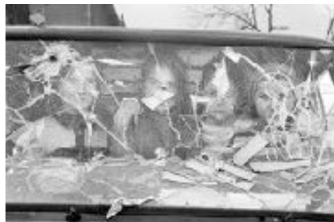
Imagen de Gervasio Sánchez (Córdoba, 1959), fotógrafo y periodista en la guerra de Bosnia

Tras acabar su faena, la niña aún mantiene los ojos fijos en su rostro. Un tiro en la frente y los ojos quedan vacíos.