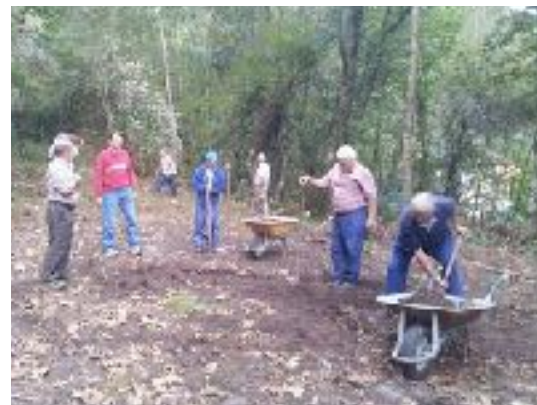
En Les Tempranes (Avalle, Parres), de sextaferia , figura de trabajo colectivo análoga a la andecha .

Los participantes en la andecha no adquirían ningún derecho de propiedad