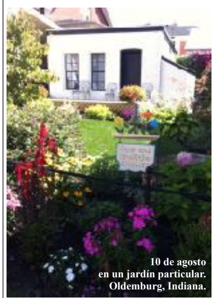
10 de agosto en un jardín particular. Oldenburg, Indiana.