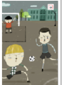
Ilustración para la novela "Los Cachorros" (Vargas Llosa, 1967) de Blanca H. de Miguel. CNICE.

1930: Se jugaba la primera copa mundial en Uruguay. El ganador fue Uruguay.