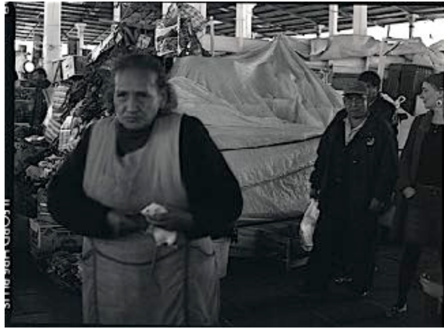
La mujer [mayor] blanquea siempre las ratoneras del hombre. La [mujer] joven aún no lo sabe. (Mercado de Atacama, Chile.)