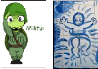
Ilustración: A. Arribas. CNICE

De Lionel Messi, el mote mas conocido es el de La Pulga , por su velocidad y su baja estatura sobre todo, pero también por su polivalencia y gran golpeo del balón,