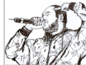
Kase O.