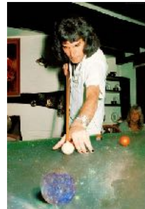
Fotocomposición de Hugo Campillo Gancedo

En la escuela, veía Mercurios por todas partes. Como elemento, como planeta, como mensajero de los dioses... Sin embargo, olvidé todos aquellos destellos de idolatría cuando escuché My fairy king . Esa canción me llamó la atención desde el primer segundo. Hablaba de caballos alados, abejas sin aguijón, ríos de vino y un rey... Escuchando las descripciones de cosas que aún me sonaban tan poco, oí una frase que me ató totalmente a aquel mundo que, como pude saber después, se llamaba Rhye . Hablaba de una madre que, tal vez,