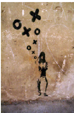
Stencil sobre pared. Arte urbano en Berlín. Goretzi Irisarri. CNICE

En la "vida cibernética" cada cual tiene una forma de ser diferente,