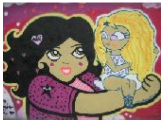
Graffiti en el barrio de la Barceloneta, Barcelona

Algo imprescindible era poner esos estados ante los que, ahora, cuando los recuerdas, se te cae la cara de vergüenza. Y te preguntas cómo podías poner cosas como, por ejemplo, Amor idiota, yo por él y él por otra . Nos reímos de las niñas que ponen esas cosas en Twitter, pero no recordamos que antes que ellas lo hicimos nosotros.