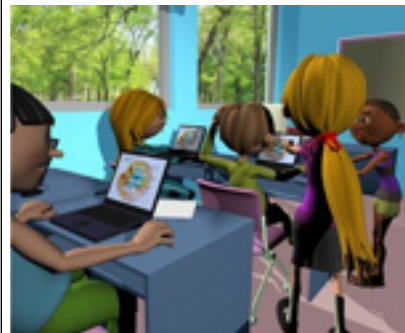
Maestra y ordenadores.

Lo que también ocurría con los cargos directivos, y aunque aún estamos lejos de la igualdad en ese sentido, al menos nos hemos alejado de aquel prejuicio sobre la capacidad de la mujer para dirigir, o de la tendencia a encomendar las tareas de dirección a los profesores-hombres.