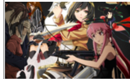
Izquierda a derecha: Hajime, Saya, Cross, Yuuki, Mikasa, Gasai Yuno y Sango. Neomujeres. Fotocomposición de A.G.