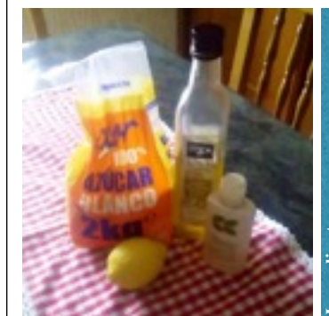
Ingredientes para los cuidados de la abuela. I.S.

Después de estos breves procesos, ellas se sentirán mejor físicamente y, además, les devolverás una pequeña parte de la atención y cuidados que ellas prestaron. Créeme, te lo agradecerán.