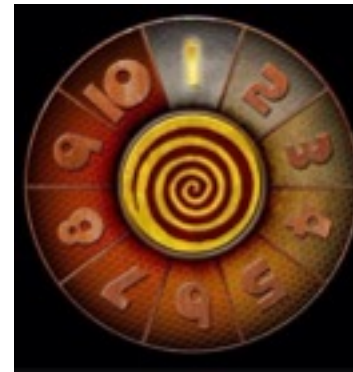
La Lista tonta

Este es el eslogan que el canal Comedy Central usó para su programa “ La Lista Tonta ” presentado por el humorista Quequé, en el que varios artistas luchan semana a semana por llegar a ser el número uno con unas canciones y videoclips...particulares.