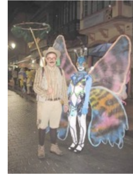
El cazador y la mariposa. Carnaval de Ribadesella. 2º Premio Individual/Parejas

Con unos coladores pintados y unas antenas hechas con muelles y pelotas de forespan , y algunos retoques más, el traje quedó acabado y listo para concursar.