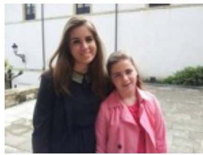
Con el apellido "Pellico"