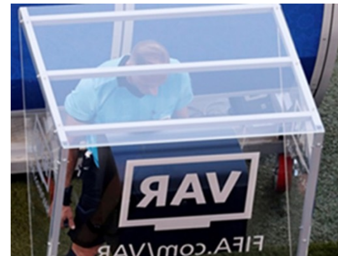
Un colegiado consulta los detalles de la jugada en el dispositivo VAR

La implantación de esta nueva herramienta será de gran utilidad para los colegiados, pero solo el tiempo dirá si el ya famoso "VAR" continuará en el centro de la polémica de las decisiones o hará del fútbol un deporte aún mejor de lo que ya es.