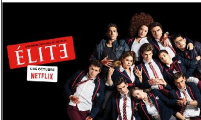
Póster promocional de la serie

Hasta el momento, Élite cuenta con una temporada de ocho episodios, pero acaba de confirmarse que la serie ha sido renovada para una segunda temporada, que será estrenada en 2019.