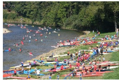
Salida de Los Xironinos , el pasado 23 de septiembre desde Arriendas. Blanca G a Bueno

Las categorías femeninas, infantiles y cadetes, en K1, como las canoístas en C1, cuentan con su propia salida media hora más tarde, desde el pueblo de Las Rozas.