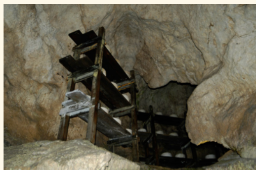
Galería de maduración. Cueva del Queso.

La visita continúa dentro de la cueva con material gráfico y paneles explicativos, con paso a una galería de escasa luz en la que,