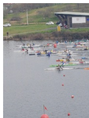
Salida del Campeonato de Invierno.

El segundo día las pruebas comenzaron por la mañana, alrededor de las 9:30. Ese día les tocó participar a los hombres Junior, Sub-23 y Sénior tanto en K-1 como en C-1, y a las mujeres Sub-23 y Sénior, también en ambas modalidades.