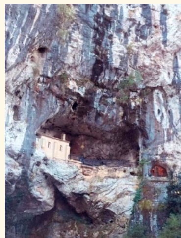
La Santa Cueva. Marta Alonso

En su interior podemos encontrar a escasos metros de la Virgen, el sepulcro de Don Pelayo, ya que sus restos y los de su mujer -Gaudiosa- fueron trasladados de la iglesia