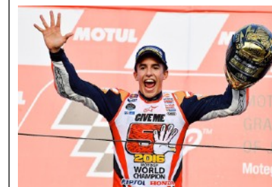
Marc Márquez celebrando su quinto mundial en Moto GP, imagen Diario AS.