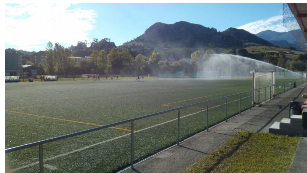
El campo municipal de Parres, en un día normal de entrenamiento.