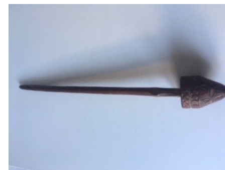
Imagen, información y jusu de Rebeca Mier Sierra