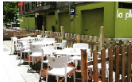
La Taberna 4 Gatos, en Arriendas, concejo de Parres. Imágenes del perfil oficial del sitio.