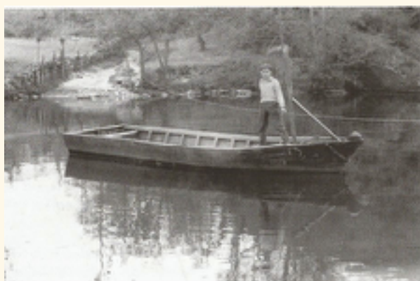
El Pozo La Barca en el río Piloña. (1960), entre las riberas de Arobes y Llamas de Parres.

Otras situaciones en las que se usaba esta barca era para transportar el ganado y llevarlo a los prados de la otra parte del río.