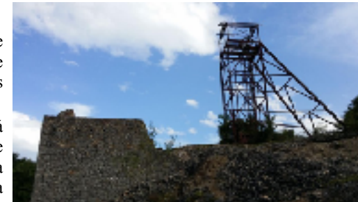
El castillete de la mina junto con un muro medio y los canales por los que circulaba el mineral.

Actualmente, lo único que queda de la mina es un castillete, compuesto por dos plataformas que empleaban los mineros para bajar y extraer el mineral. También