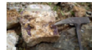
Barita con fluorita en la zona de Berbes, Ribadesella.

"De críu me contaban los vecinos del barrio de La Llamera, que es el más próximo a la mina, que cuando estaban picando temblaba el suelo mucho; y siempre se pensó que la mina pasaba por debajo de las casas".